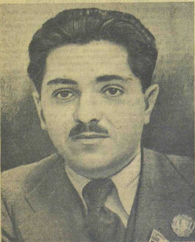
Герой Социалистического Труда И. Т. Тевосян

Председатель Президиума Верховного Совета СССР М. КАЛИНИН. Секретарь Президиума Верховного Совета СССР А. ГОРКИН. Москва, Кремль, 30 сентября 1943 г.